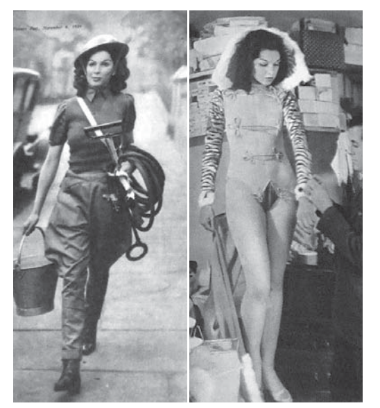
図3 1939年11月4日号 「空襲パトロール」からグラマーなダンサーへ ( "Air Raid Warden to Glamour Girl")

拙稿で、イギリスにおける女性の戦時貢献、また PP の表紙写真における女性表象の傾向について報告した。<sup>(4)</sup> そこで見られる表象の傾向がこの時期の女性表象にも見られる。 図3には、ショーガールの女性が余暇を利用して空襲パトロールのボランティアをしている。図4の、10月14日号の「笑い」という記事は、英空軍(Royal Air Force、以下 RAF)に採