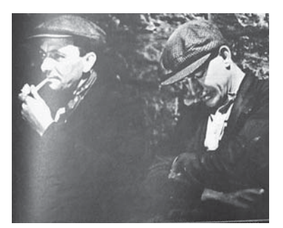
図12 1940年8月17日号 シェルターの生活:ヒトラーを打ち負かす精神: ブリテンの労働者たちは再び働くときを待つ。

名取洋三はメディアにおける写真の扱い方について、新聞の写真(ニュース写真)と、週 間グラフ誌の(報道写真)は本質的に違うと述べている。例えば、火事の現場を写した写真 は新聞でしか使えない。週刊誌で使える写真は、火事のときの状態を一週間後にも思い起