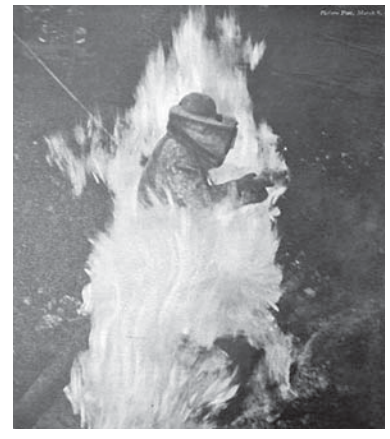
図9 1941年3月8日号 消防のクライマックス

⑧の「いつも通り営業中」では、空襲の中から掘り起こ された「掘り出し物」(salvage、攻撃を受けた店舗、家屋 から救出されたものが「ノックダウン・プライス」 (knock-down price)で販売する商店街の様子が記録さ れている。空襲後にも関わらず驚くべきスピードで、「日 常」をとりもどそうとする人々の姿、変わり果てたオフィ