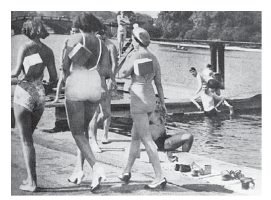
図2 1939年9月23日号 公園でも——最後の水浴び

拙稿で、イギリスにおける女性の戦時貢献、また PP の表紙写真における女性表象の傾向について報告した。<sup>(4)</sup> そこで見られる表象の傾向がこの時期の女性表象にも見られる。 図3には、ショーガールの女性が余暇を利用して空襲パトロールのボランティアをしている。図4の、10月14日号の「笑い」という記事は、英空軍(Royal Air Force、以下 RAF)に採