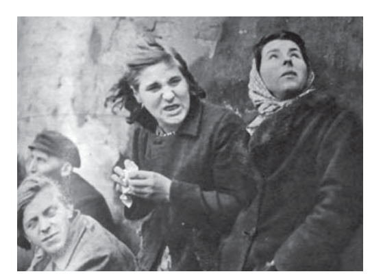
図17 1945年5月17日26巻11号 敗北したドイツ人はどんな顔?

「これが、ヒトラーがドイツの運命として意図していたことなのか!」 幻想から覚めた人々が目にしたものは戦争の現実、損失と恥辱の悪夢である。彼 らの誰が、ここから何かを学ぶほど若々しくあるだろうか。(1945年5月17日号 The Beaten German: What is he Like?)