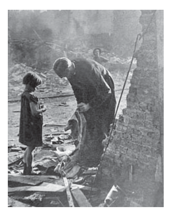
図11 1940年11月23日号 瓦礫の中の司祭: 隣人たちの宝物を救出する

「たくましいイギリス人」にとっては、シェルターでの生活 も適応できないものではなかった。⑤は空襲後の表通りの風 景を、⑥では防空壕を中心とした地下シェルターの生活が記 録されている。シェルターは単に避難する場所であるばかり ではなく、職場であり、娯楽の場でもあった。チャーチル首 相が自分のオフィスのスタッフを「穴居人たち」("fellow troglodytes")と呼んだように、さまざまな職場が地下に移 された。老若男女がそれぞれの仕事、生活、娯楽の時間を地 下で過ごす様子が記録されている。ロンドンの地下鉄は格好 の防空壕となった。(Rodger:1991,102) PP のシェルターを 扱った記事には、やはりホーム・フロントのヒーロー、ヒロ