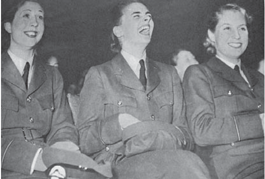
図4 1939年11月4日号 RAFの女性たち、大笑い

用された若い女性たちのくったくのない笑顔 である。若い女性たち("girls")は、笑顔や「美 しさ」(脚線美を含む)がクローズアップされ ている。RAFの女性たちは、厳しい訓練を