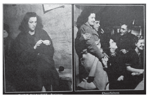
図13 1940年10月26日号 シェルターの生活: 長所「忍耐」(左)、「陽気」(右)