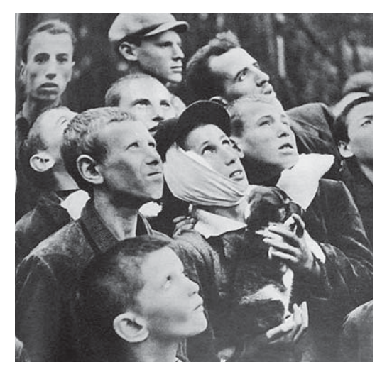
図5 1939年9月13日号 独のポーランド侵攻「また爆撃軍が来た…」 子どもをターゲットにするナチス・ドイツ

ここでは、自分自身の身を守ることもおぼ つかない「子ども」が自分の小さな子犬を守ろ うとしている。一方、独軍はこのような弱い 「子ども」までをもターゲットにしている。弱 者との対比は、ドイツの「非道」ぶりを強調す る。1939年9月17日から、独軍は、ポーラン ドのワルシャワに対する爆撃を開始する。非 戦闘員を避難させるという交渉が決裂し、多 くの市民が犠牲となった。名目上は軍事関連 施設への「精密爆撃」であったが、実質的には 無差別爆撃になってしまった。ワルシャワで は独軍は5回の降伏勧告をつきつけるが、 ポーランド軍及び市民は拒否したため、9月