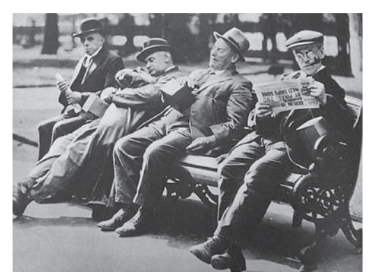
図1 1939年9月23日号 まだホントに平穏なホーム・フロント

都市への空襲に備えて、警察、消防、空襲パトロール(A.R.P.: Air Raid Patrol)を組織、 そして子どもたちの疎開(Evacuation)が実行されていく。9月23日(5.3)号の「戦争が 始まった。だけどイギリス人はいつも通り」では、公園でくつろぐ山高帽の男性たち、残 り少ない夏を楽しむ女性たちと、「戦時」とは思えない姿が伝えられる。しかしながら彼ら の首には、四角いガスマスクを携帯する箱が見られる(図1、2)。