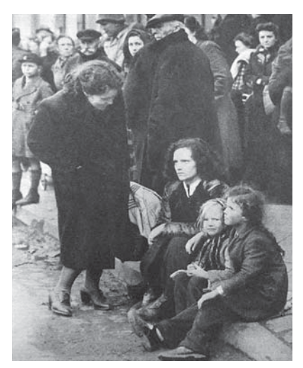
図18 1945年5月17日26巻11号 敗北したドイツ人はどんな顔?