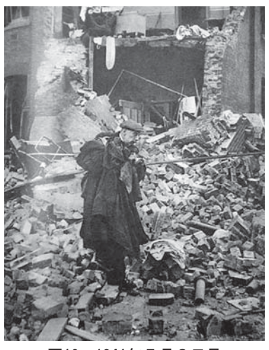
図10 1941年5月3日号 空襲の翌朝

ナチスが崩そう (rattle) としている男:1941年のイギリスの市民 彼はイギリスの都市部に住んでいる。彼の住居はナチ爆撃機のターゲットとなっ た。彼のわずかばかりの財産、何年も貯金をして買い集めたものたちは、彼らの 軍事的目的となった。爆弾は落とされ、彼の家は形のない煉瓦の山となった。彼 は落ち着いて、できるだけのものを持ち出し、後片付けを始めている。(1941年5 月3日 Morning after the Blitz 図10)