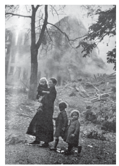
図6 1940年6月1日号 家を失った小さな家族

1940年6月8日号は、「電撃戦」の特集号で、フランス、 ナンシーの被害状況を生々しく伝えている。ここでもま た、非戦闘員、特に一般市民への攻撃、病院・学校、そ して教会など非軍事的施設への攻撃が非難されている。 バラバラに崩壊した教会の祭壇の写真につけられたキャ プションをみてみよう。