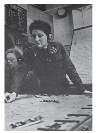
図7 1943年11月6日号 迎撃隊を誘導する女性管制官

上記の分類を手がかりに PP 掲載の写真を見てみよう。戦場へ一人でも多くの男性たち を送るため、女性たちはさまざまな職業についた。②はこうした女性たちの姿である。 PP の表紙写真では、制服を身につけ、公共の交通機関、さまざまな戦時労働、軍隊の支 援部隊で働く女性たちが登場する。若い女性たち(girls)の表象については、「笑顔」が強調 されていたが、記事の中では必ずしも若い女性に限らない。前章で扱った時期には「笑顔」 が強調されていたが、1940年夏以降は、任務に取り組む真剣な表情が見られる。必ずしも