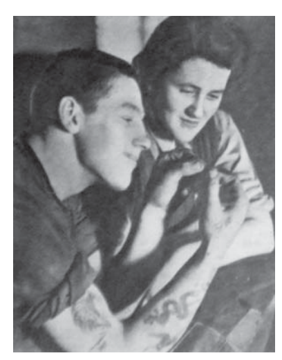
図14 1943年1月23日 Darn and Mend Afternoon: A.T.S. Give Soldiers A Lesson : Tough Job for Tough Fingers 入隊時、筋骨たくましい男性が、ま

行機に乗ることはなかった。女性のパイロットが活躍できたのが、航空運輸援助隊 (Air Transport Auxiliary) である。 工場から RAF の空港まで、年間 1 万台ほどの飛行機を運ぶ。 666 人のパイロットの内、 150 人は女性であった。 1944 年 9 月 16 日(24.12)