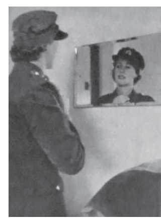
図6 1940年2月17日 (6.17) The Qualities of Britain's Women at War: Smartness The Last Glance in the Mirror

図 6 に見られるように、任務の前に鏡をちらりと見て、身だしなみをチェックする姿を一緒に掲載する点は、後にも触れるが戦時労働に就く女性の凛々しい姿に「女らしさ」を添える方法として特徴的である。