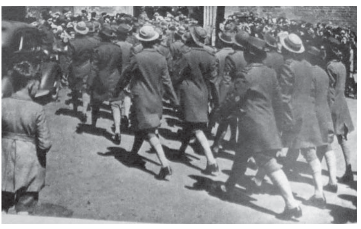
図17 1943年5月29 日(19.9) Snapshots at a Land Girls' Rally 左: The Man With the Expert's Eye 右: The Girls He came to See カ強く、日焼けしたランド・ガールズの行進。かつては事務仕事などをしていたが、今や雨風でも戸外で働く。

に掲載している。また若い女性たちがイギリスの守るべき自由を表象していると考えられることについては前述の通りである。このランド・ガールの表象は、この二つの役割を同時に担っていると言えるであろう。一方、整然と行進するランド・ガールに厳しい視線を注ぐ男性の写真がある。キャプションには、「専門家の目を持つ男性:彼は農業と農家について全てを知っている。そしてどのような労働者が農地に向くのかを知っている」とある。この配置は、Iで述べた軍隊の後方支援の女性たちの描かれ方と共通している。戦時という緊急時において、男性の指導者、あるいは読者のまなざしの下、女性たちが規律正しく行動し、労働者としての有能さを示す場面を捉えている(図 17)。