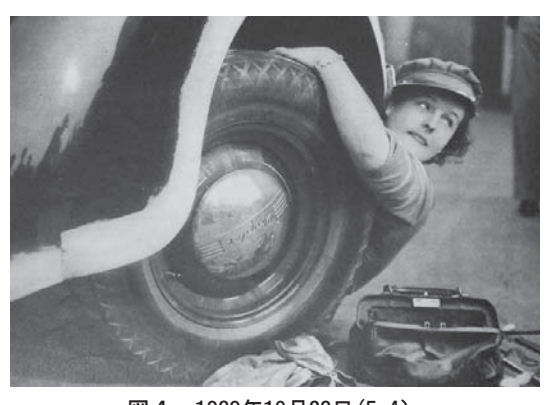
図 4 1939年10月28日 (5.4) On the Home Front: A Difficult Job for a London M. T. Girl

縁であったかのように見える重労働の組み合わせが生み出すコントラスト、そして戦時故に、去っていく男性を惜しむだけでなく、女性は普段とは違う労働にも積極的に取り組むべきである、またそうした労働をできるところを見せよう、というメッセージがメディアを通して発信される点はアメリカの場合と共通しているであろう。<sup>(4)</sup> 図4では、巨大なタイヤと格闘している女性のけなげな姿が示されている。彼女は、特殊車両運送訓練隊(Mechanised Transport Training Corps、以下MTC)に所属するM.T.ガールである。この団体は、1939年に通産省管轄のもと創設されたボランティア団体で、当初は家庭があり、フルタイムで働くのが難しい女性がパートタイムで運転の業務につける機会を提供していたが、連合軍の後方支援も担うことになる。1941年12月の「国家動員法」(The National Service Act)の成立に伴い、正式に活動を認められ、賃金も出るようになった。この頃には、16歳~18歳を対象にした任務に入る前の訓練を行う団体(Girl's Training Corps)も活動を開始していた。いわゆるバトル・オブ・ブリテン、また独軍によるブリッツ(Blitz)時にも大いに活躍し、表彰されたものもいる。<sup>(5)</sup>彼女たちの労働について記事では「平時であれば、彼女に