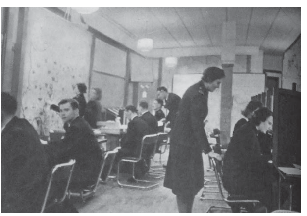
図7 1941年2月8日 (10.6) Before the Great Drive Forward

これまで男性だけの職場に女性が進出することによって、受け入れる男性の組織側に戸惑いが見られた。空軍では、以前より軍隊内部の治安を保つため警察部門が設けられていた。しかしながら男性警官は、問題が起きたときに女性たちを取り締まることに当惑していた。そこで1942年には、女性たちを取り締まるための女性警官が選ばれ