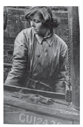
図20 1944年6月24日 (23.13) Women Man the Barges on the Midland Canal 歴史で学士号を取り、教職をめ ざしていたこの女性は今やベテ ランのボートの操縦士である。