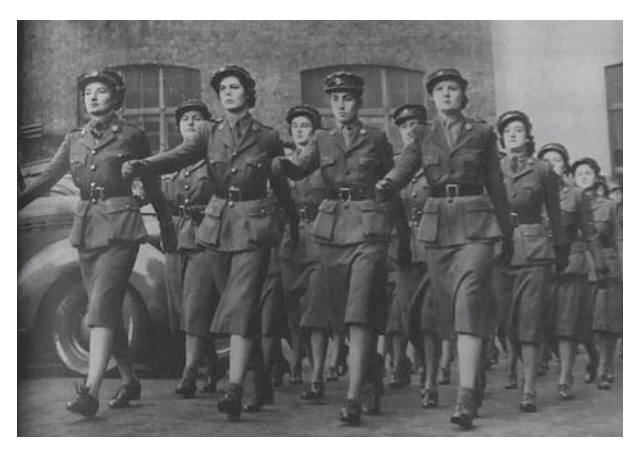
図5 1940年2月17日 (6.17) The Qualities of Britain's Women at War: Discipline