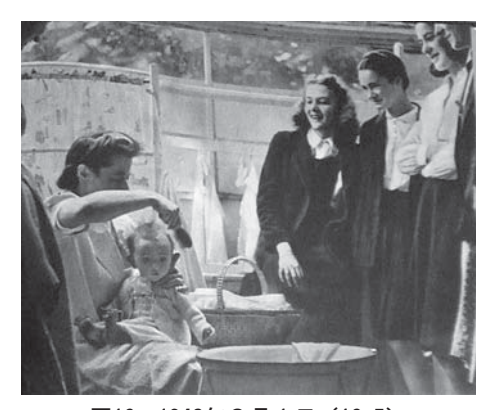
図16 1942年8月1日 (16.5) School Girls Train For Motherhood

多くの女性が「市民」として国家に貢献できることを示した戦時下は、少女たちにも「市 民」として将来のヴィジョンを描き、行動することが求められた時代でもあった。ここか らは、前述した制服の女性たちの「妹たち」の活動を扱った記事を取り上げる。