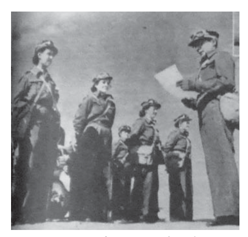
図15 1944年8月5日 (24.5) Desert Girls Move on to Italy 多様な国籍・民族を抱えるATS

恐怖から各地を解放するために戦うイギリスの制服を身につけることに誇りを持っている、と記されている。解放をもたらす連合国軍に対する避難民たちの「恩義」と、一緒に戦う「誇り」、そして打倒ナチスという共通の目的が確認される。一方、男性たちと共に厳しい環境の中を進軍する ATS であるが、休憩時間にお互いに鏡を見せあい身づくろいする姿の写真が、彼女たちの「女らしさ」を表すものとして一緒に掲載されている。