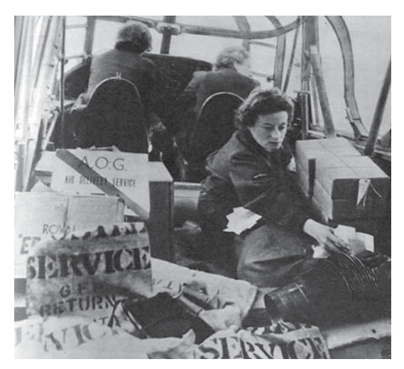
図13 1944年9月16日 (24.12) The Work of Ferry Pilots

行機に乗ることはなかった。女性のパイロットが活躍できたのが、航空運輸援助隊 (Air Transport Auxiliary) である。 工場から RAF の空港まで、年間 1 万台ほどの飛行機を運ぶ。 666 人のパイロットの内、 150 人は女性であった。 1944 年 9 月 16 日(24.12)