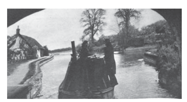
図21 1944年6月24日 (23.13) Women Man the Barges on the Midland Canal In Britain Life Goes On: The Girls Who've Reinforced the Regular "Boaters" Do a Trip of 134 Miles: 女性が守る運河の風景

Man the Barges on the Midland Canal)は、「男性たちが去り、第二戦線で戦う間、女性たちはより多くの重労働をホーム・フロントで担っている」と始まり、カーブの多いこの運河を走る船を操る女性たちについて述べられている。作業は重労働であるにも係らず、田園が続く134マイルの運河を走る船というイギリスの風景は、男性が不在であっても、女性によって維持されていることをこの記事は讃えている(図 20、21)。