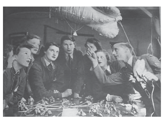
図9 1942年6月13日 (15.11) The WAAF Learn To Man the Balloons バルーン操作の講義。女性が「興味の持てない事柄 (stodgy facts)」でも、ミニチュア模型を使いわか りやすく説明する。

「女性には、模型を使って指導すると理解が早いことがわかった。ミニチュア模型は特に女性たちの記憶力に訴えるものがある。それから、もちろんであるが、魅力的な環境に置くことによって、女性たちは最も能力を発揮できる。操作について学ぶ部屋は緑色に塗られた。また宿舎の外でガーデニングを楽しめるよう、用具も揃えられた。バルーン・ガールたちが重労働と孤独の伴うこの生活を楽しめるように、できる限りの配慮がなされた」(1942年6月13日、15.11 図9)。