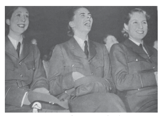
1939年10月14日 (5.2) Laughter: Women of the R.A.F. Reserve Get One Good Laugh, Anyway

同号の「笑い:トラブルに合った トラック…」には、泥にタイヤをと られたトラックを救い出した後の訓 練中の ATS の頼もしい笑顔や、また、 これから海軍の任務に就く恋人との 別れを惜しんでいたのに、あくる日 には、これまでやっていた店員の仕 事を辞め、ランド・アーミーとして 食料供給に貢献する決意を固めた女 性の笑顔が掲載されている(図2、 3)。彼女たちの笑顔は、戦時に際し、 国民の不安を和らげ、また女性たち の戦時労働への参入を促す効果が あったであろう。女性とそれまで無