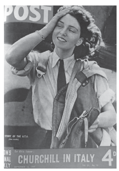
図12 1944年9月16日 (24.12) 表紙 The Story of the A.T.A.