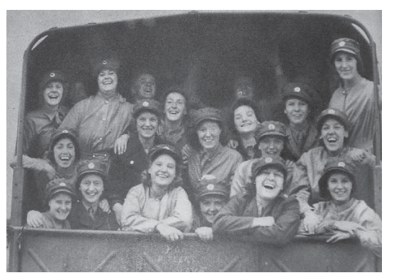
1939年10月14日(5.2) And The Girls Who Got It Out