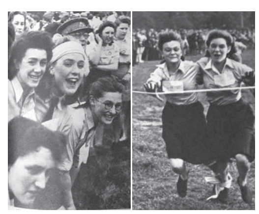
図18 1943年7月17日(20.3) Girls' Rally 運動会に大興奮。自分の団を応援する。