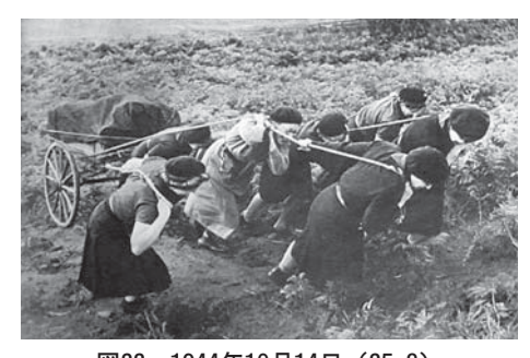
図22 1944年10月14日 (25.3) Guiders Prepare to Fight Hunger and Disease in Europe ヨーロッパ解放を視野に入れて、救援活動の 準備をするガイダー。

少女たちの活動の中でも特に、ヨーロッパの難民の問題を自分たちが解決すべき問題として捉えていたのが「ガイダー」(Guider) たちである。イギリスでは、第一次世界大戦前から、ボーイ・スカウト運動と共に、その少女版と言えるガール・ガイド運動が発展していた。<sup>(10)</sup> ガイダーたちは、その運動の中でも年上の指導者的立場である。1944年10月14日 (25.3)「ガイダーたちは、ヨーロッパの飢えと病気と戦う準備をしている」(Guiders