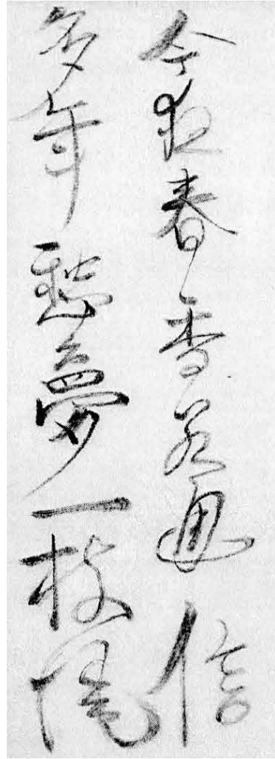
図2 翠濤による一休宗純筆「墨梅図」の臨書 (『一休禅師賛墨梅記』より転載)